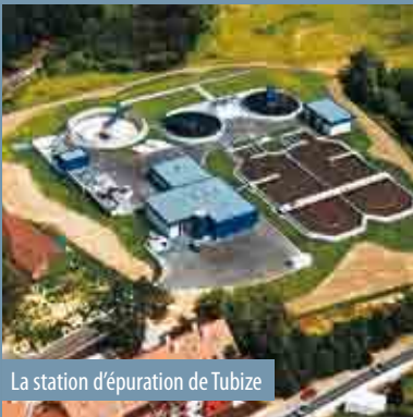
La station d'épuration de Tubize