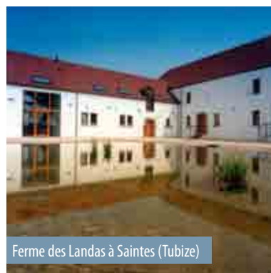
Ferme des Landas à Saintes (Tubize)