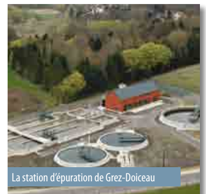
La station d'épuration de Grez-Doiceau