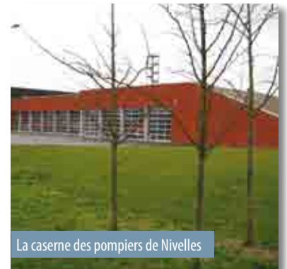
La caserne des pompiers de Nivelles