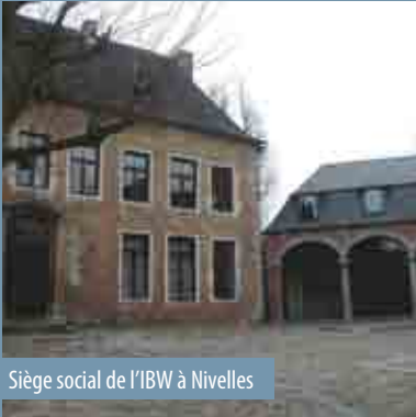
Siège social de l'IBW à Nivelles