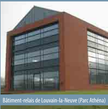
Bâtiment-relais de Louvain-la-Neuve (Parc Athéna)