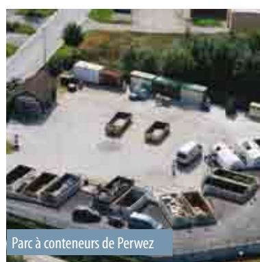
Parc à conteneurs de Perwez