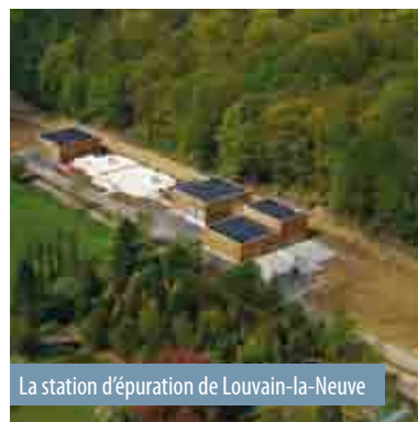
La station d'épuration de Louvain-la-Neuve