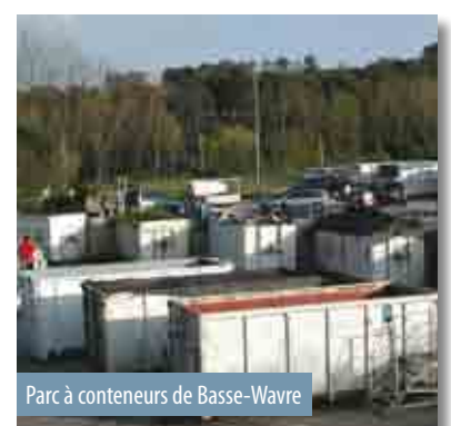
Parc à conteneurs de Basse-Wavre

L'Intercommunale est certifiée selon les normes environnementales ISO 14.001 et EMAS depuis 2002