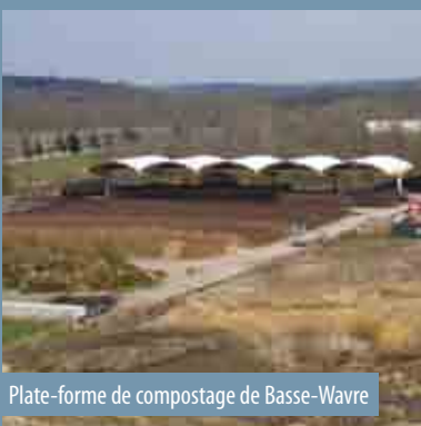
Plate-forme de compostage de Basse-Wavre