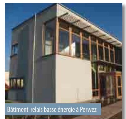
Bâtiment-relais basse énergie à Perwez