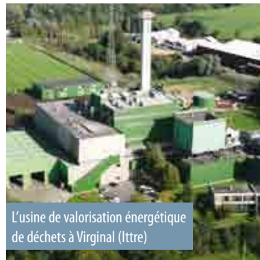
L'usine de valorisation énergétique de déchets à Virginal (Ittre)